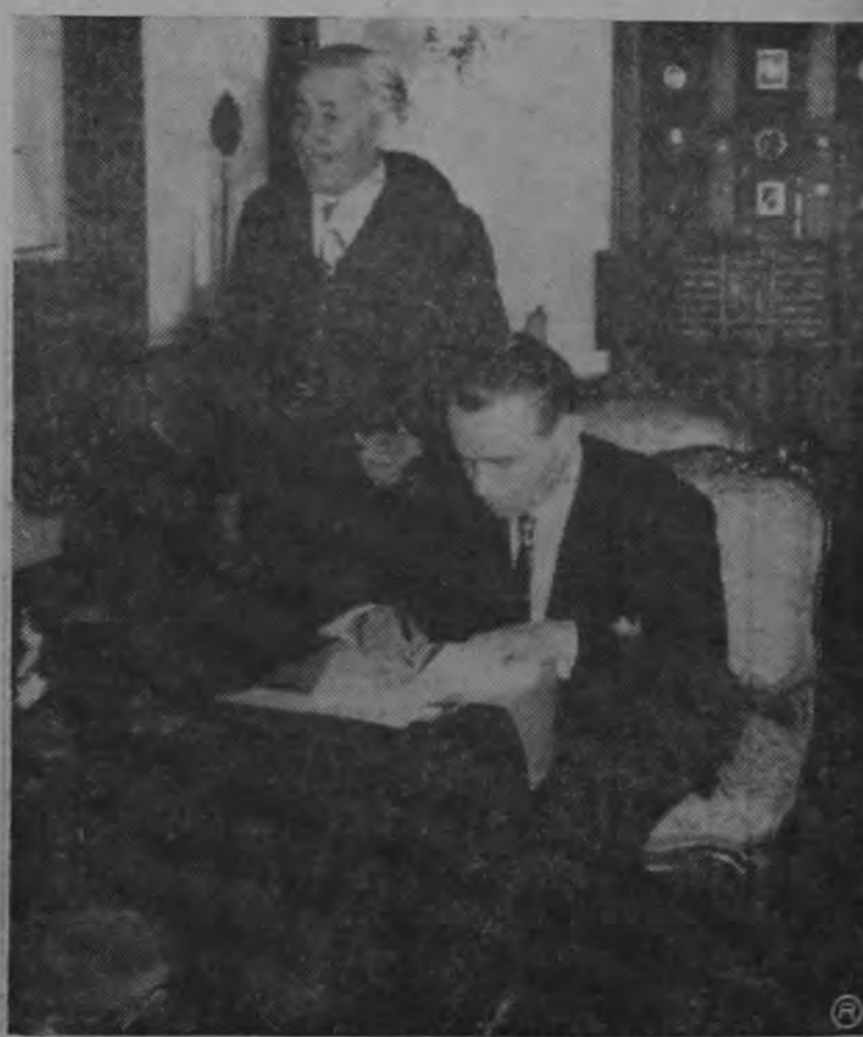
El Presidente de la Sociedad de Autores de Costa Rica, señor Cortés, poniendo su firma en el documento sobre reciprocidad de derechos con los autores mexicanos.

El Comité Gestor de la Casa de Nra. Sra. del Rosario de Fátima, adscrita al Patronato Nacional de la Infancia trabaja activamente en todo lo relacionado con la próxima apertura de esta urgente institución, pero esos esfuerzos serán nulos si Ud. no presta su cooperación. La necesitamos.