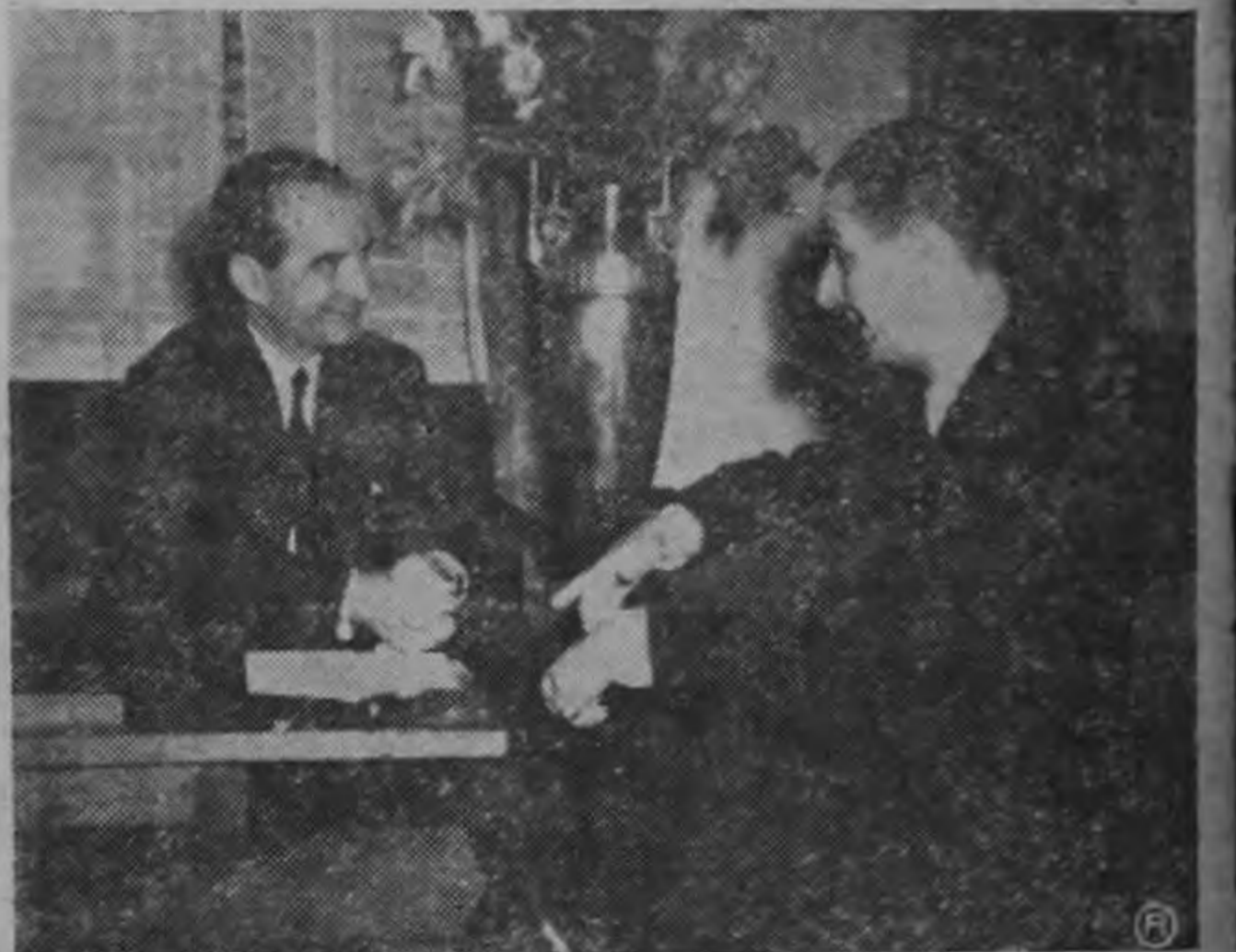
El señor Embajador del Brasil departiendo cordialmente con el Presidente Electo, don José Figueres.