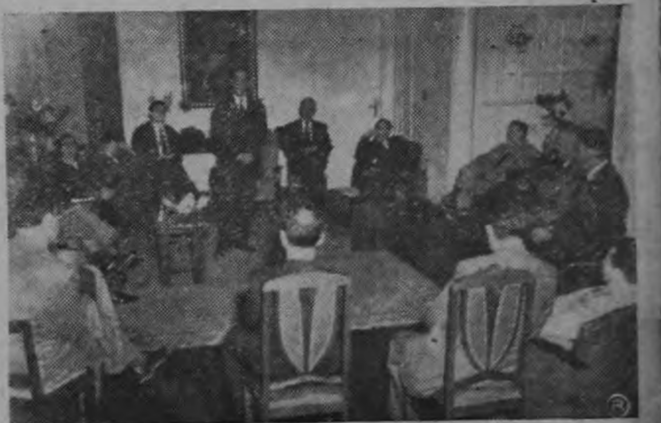
Grupo de distinguidos médicos que ayer se constituyeron en la residencia de don José Figueres para presentarle sus saludos. (FOTO TRISTAN).