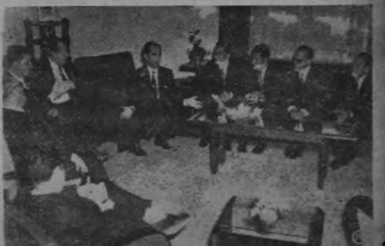
Don José Figueres conversando con los dirigentes del Dormitorio Soldado, que acudieron a congratularlo.